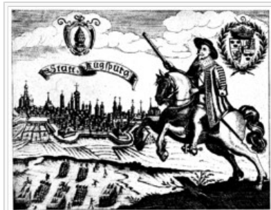
Hyllningsgravyr med anledning av Gustav II Adolfs, "befriaren", intåg i Augsburg 1632. Överst två sköldar med Augsburgs stadsvapen och svenska riksvapnet.