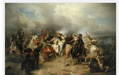
Gustav II Adolfs död i slaget vid Lützen, målning av Carl Wahlbom från 1855

Gustav II Adolf begravdes den 22 juni 1634 i Riddarholmskyrkan i Stockholm, där han året innan han gick ut i det tyska kriget själv hade utsett sin grav. I en inskription i kyrkan, kan man läsa [om Gustav II Adolf]: In angustiis intravit (I trångmål begynte han sin bana). Pietatem amavit (Fromheten älskade han). Hostes prostravit (Fienderna nedslog han). Regnum dilatavit (Riket utvidgade han). Suecos exaltavit (Svenskarna upphöjde han). Oppressos liberavit (De förtryckta befriade han). Moriens triumphavit (I döden triumferade han). [4]