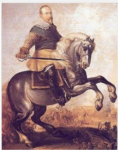
Gustav II Adolf i slaget vid Breitenfeld den 7 september 1631

Staden Magdeburg hade under årens lopp spelat den främsta rollen bland Nordtysklands protestantiska fria städer, och hade redan under hösten 1630 gett det första exemplet på frivillig anslutning till den svenske kungens sak. Försöken att vinna de protestantiska furstarna var dock förgäves. Under ledning av kurfurstarna av Sachsen och Brandenburg planerade dessa istället på konventet i Leipzig att bilda en ny evangelisk union, ett tredje parti som under väpnad neutralitet skulle kunna inta en självständig ställning mellan kejsaren och Gustav II Adolf, i vilken de ännu endast såg en i riket inträngande främling. Endast lantgreven Vilhelm av Hessen och hertigarna av Sachsen-Weimar vågade öppna förbindelser med honom.