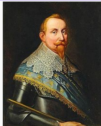
Kung Gustav II Adolf av Sverige