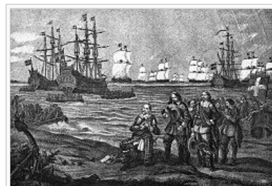
Gustav II Adolf landstiger i Tyskland den 25 juni 1630