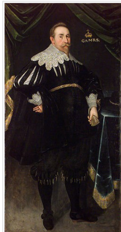
Gustav II Adolf porträtterad av Jacob Heinrich Elbfas ca 1630

Förgäves hade Johann Tserclaes Tilly , som efterträtt Albrecht von Wallenstein 1630, försökt tränga tillbaka sin motståndare till östersjökusten. Efter ett misslyckat fälttåg i Mecklenburg i februari 1631 hade "den gamle korpralen", med vilken Gustav II Adolf där för första gången mötte sina styrkor, måst dra sig nedåt Elbe för att genom erövringen av Magdeburg , norra Tysklands starkaste fästning , hindra Gustav II Adolf från att vinna fast fot även vid denna flod. Under tiden befäste Gustav II Adolf sin ställning genom ett fördrag med Frankrike , som slöts i Bärwalde i januari 1631 . Fördraget innebar att Frankrike skulle betala Sverige subsidier på 400 000 riksdaler per år under fem år, med villkoret att Sverige skulle hålla en armé på minst 36 000 man i Tyskland. Detta gav Gustav II Adolf medel att fortsätta kriget.