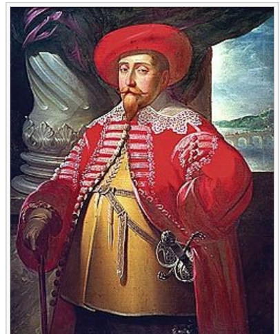
Gustav II Adolf iförd polsk rock, målning av Matthäus Merian d.ä. från 1632